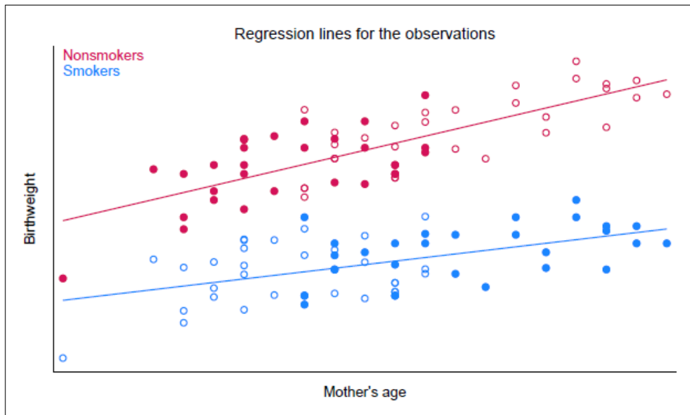
図5 直線のフィット

図5はRA法の背景にある原理を示しています。母親が喫煙しなかったとするなら赤の回帰直線を使って出生時体重の予測が行え、逆に母親が喫煙していたとするなら青の回帰直線を使って出生時体重の予測が行えるわけです。特定の年齢の母親に対する喫煙による処置効果は赤と青の回帰直線間の垂直方向の隔たりで表されるわけです。